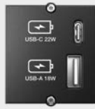
USB A&C Custom Modul